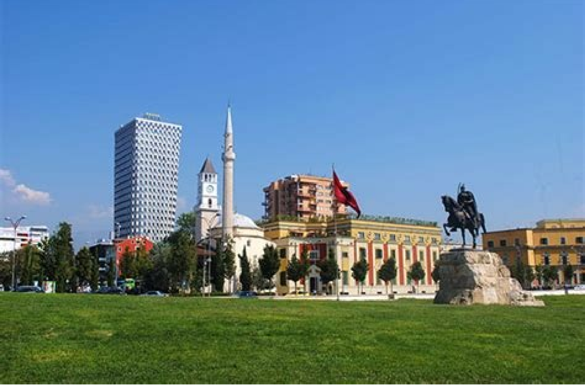
Reisebüro prishtina ne prishtine.